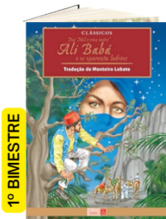
ALI BABÁ E OS 40 LADRÕES (Autora: tradução de Monteiro Lobato Editora: IBEP ).