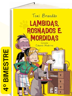
LAMBIDAS, ROSNADOS E MORDIDAS (Autor: Toni Brandão Editora: Panda Books).