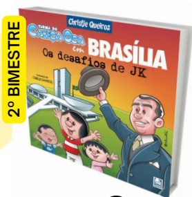
CABEÇA OCA EM BRASÍLIA . OS DESAFIOS DE JK (Autora: Christie Queiroz / Editora: CMQ-Goiânia).