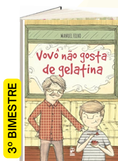
VOVÔ NÃO GOSTA DE GELATINA (Autora: Manuel Filho Editora: Panda Books).