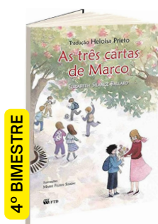
AS TRÊS CARTAS DE MARCO (Autora: Elizabeth Silance Ballard / Tradução: Heloisa Prieto / Editora: FTD).

» UNIFORME: Os uniformes podem ser encontrados na GOIÁS MINAS e RICK SPRESS UNIFORMES.