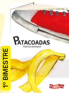
PATACOADAS (Autora: Patricia Auerbach / Editora: Escalarte).