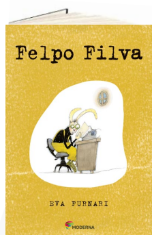
Felpe Filva. (Autora: Eva Furnari - Editora Moderna).