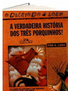
A verdadeira história dos três porquinhos (Autor: John Scieszka - Editora: Companhia das Letrinhas).