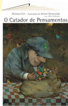
O catador de pensamentos (Autor: Mônica Feth - Editora: Brinque Book).

LIVROS LITERÁRIOS: (Todos os livros devem ser adquiridos no início do ano letivo e entregues à professora, pois após este período podem não estar disponíveis nas livrarias.) CHECK