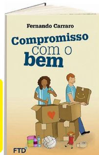
COMPROMISSO COM O BEM (Autor: Carraro / Editora: FTD).