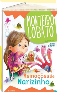
AS REINAÇÕES DE NARIZINHO (Autor: Monteiro Lobato / Editora: Ladone).