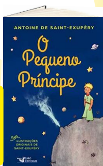
O PEQUENO PRÍNCIPE (Autor: Antoine de Saint-Exupéry / Editora: Faro).