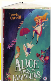
ALICE NO PAÍS DAS MARAVILHA (Autora: Lewis Carroll / Editora: Ciranda Cultural).