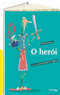
O HERÓI (Autora: Flávia Savary / Editora: Positiva).