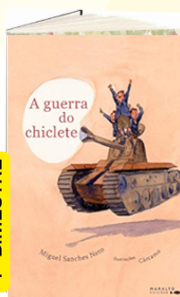
A GUERRA DO CHICLETE (Autor: Miguel Sanches Neto / Editora: Positivo).

» UNIFORME: Os uniformes podem ser encontrados na GOIÁS MINAS e RICK SPRESS UNIFORMES.