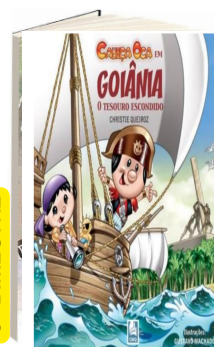
CABEÇA OCA EM GOIÂNIA: TESOURO ESCONDIDO (Autor: Christie Queiroz / Editora: CMQ).