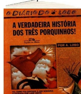
A VERDADEIRA HISTÓRIA DOS TRÊS PORQUINHOS (Autor: John Scieszka - Editora: Companhia das Letrinhas).