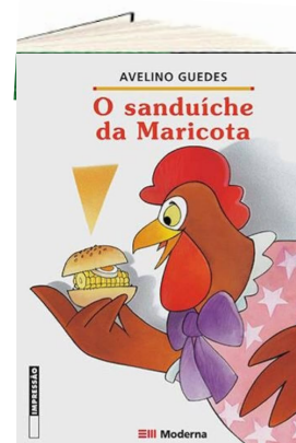
O SANDUÍCHE DA MARICOTA (Autor: Avelino Guedes. Editora: Moderna)