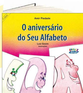
O ANIVERSÁRIO DO SEU ALFABETO (Autor: Amir Piedade. Editora: Cortez)